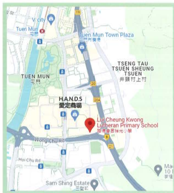
地址：屯門安定邨第四小學校舍